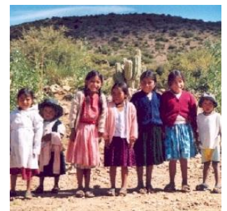
Centro de Acogida Infantil "Adrián W. Paz"

Es nuestro pequeño grano de arena a gente que lo necesita con urgencia.